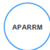
APARRM Ass. de Produtores Agrícolas da Região de Rio Maior