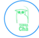
Cooperativa "Terra Chã"