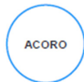
ACORO Ass. de Criadores de Caprinos e Ovinos do Ribatejo e Oeste