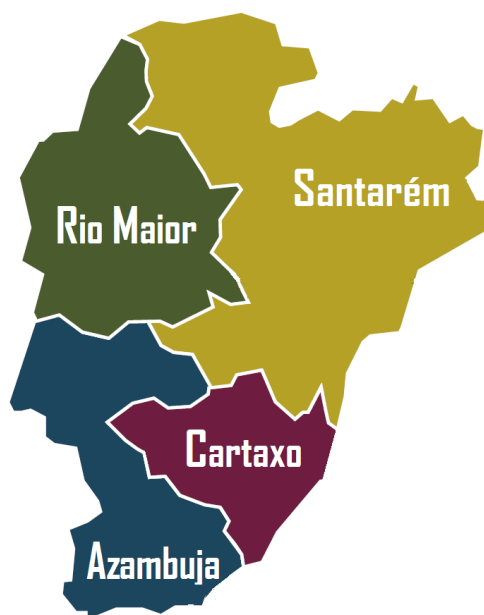
Figura 1. Delimitação Territorial da APRODER

Detém uma superfície agrícola utilizada (SAU) de 499 km 2 , cerca de 40% do total do território.